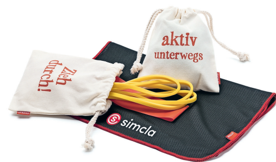
Die ziehen alle Blicke auf sich: massgeschneiderte Werbeartikel von simcla.

Laufend sind wir auch auf der Suche nach neuen Ideen, die unter fairen Bedingungen und/oder umweltschonend hergestellt werden und zusätzlich res-